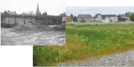
Réhabilitation de la friche Miroux