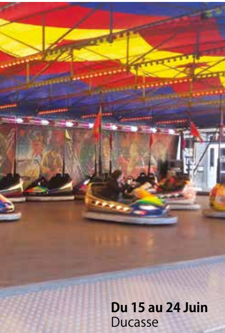
Du 15 au 24 Juin Ducasse