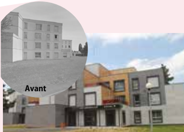
Résidence les Jonquilles après