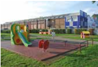
Création d'une aire de jeux