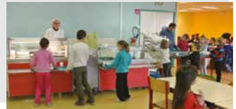
Installation d'un self